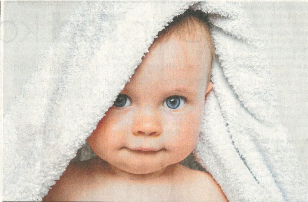
2018 haben Ulm und Neu-Ulm ordentlich Zuwachs bekommen.